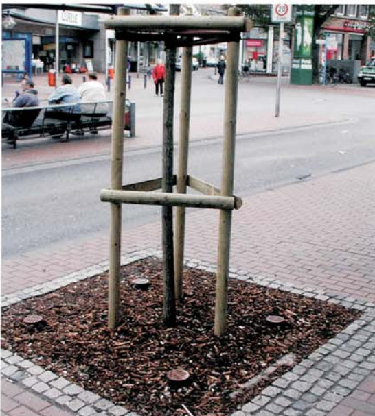
Teleskopierbares Oberteil mit Trapezgewinde, 5 Schlitzreihen 6 mm, beidseitig angeordnet, UV-beständig, Farbe braun.